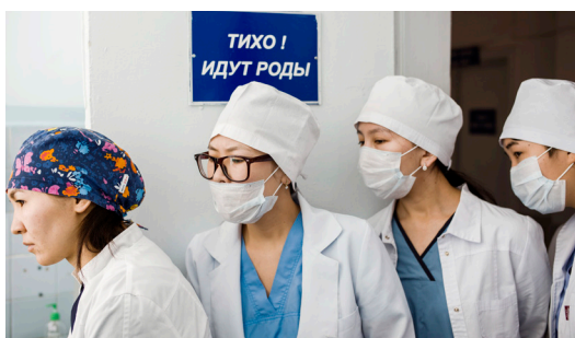
Молодые родители в Национальном центре охраны материнства и детства;